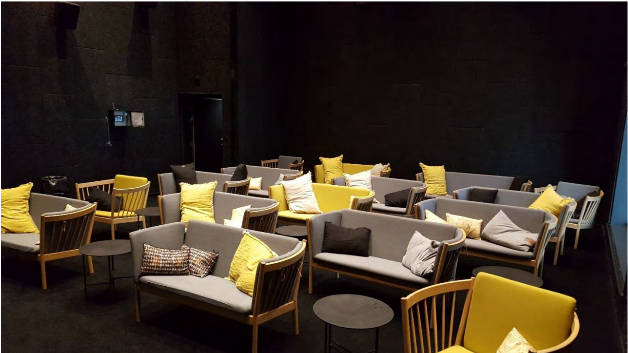
Vores lille biografsal med lækre sofaer

Et bredt spektrum af film var på plakaten det år. Dokumentarer, børnefilm, ungdomsfilm, komik, action, drama og masser af kærlighed. De frivillige filmbookerne kan alle genrer og de lige så frivillige billetsælgere sørger for at afhænde sæderne i både bio 1 og bio 2. I alt blev der solgt 36.400 billetter i 2019. Inkluderet heri er de meget populære optagelser af operaer fra de store scener i verden, som er blevet fast repertoire i store sal. Den bedst sælgende var Tryllefløjten, som havde 132 besøgende til en forestilling. Der var i alt 10 aftener med operafilm fordelt over året og der blev også vist 2 koncertfilm.