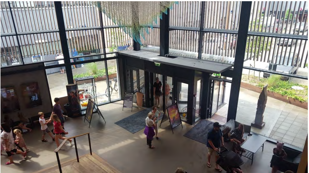
Kig i foyeren, hvor man kan se skulpturen "Øksen" udenfor og "Wings" hænger smukt fra loftet.